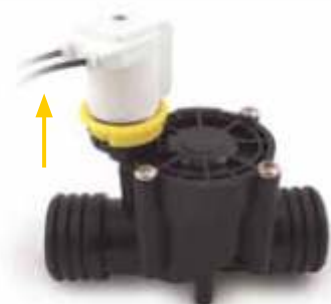
3 - Levantar Anillo Amarillo de seguridad