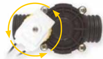
2 - Girar Solenoide