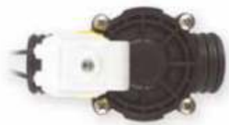
1 - Posición de Inicio